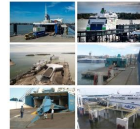
MarCom Working Group Report N° 167 - 2023

THE DESIGN OF TERMINALS FOR RORO AND ROPAX VESSELS