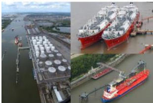
MarCom Working Group Report N° 153B - 2022

RECOMMENDATIONS FOR THE DESIGN AND ASSESSMENT OF MARINE OIL, GAS AND PETROCHEMICAL TERMINALS